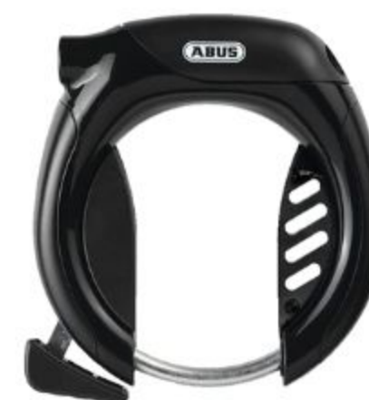
ANTIVOL DE CADRE