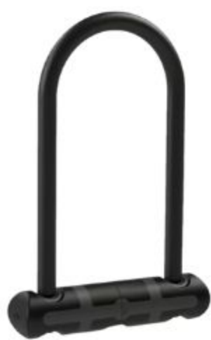
ANTIVOL EN U

Choisir un antivol 2 roues www.fub.fr/types-antivols/types-antivols